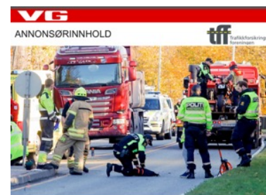
FORT GJORT: Det er flere årsaker til at folk... Les hele